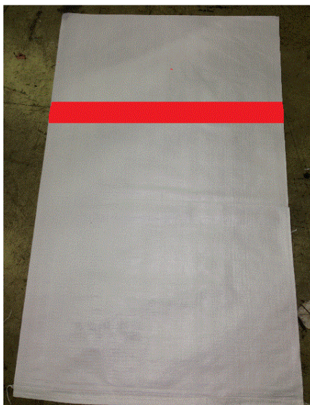
图 4. 带电货物的外装大袋子必须贴上红色胶带