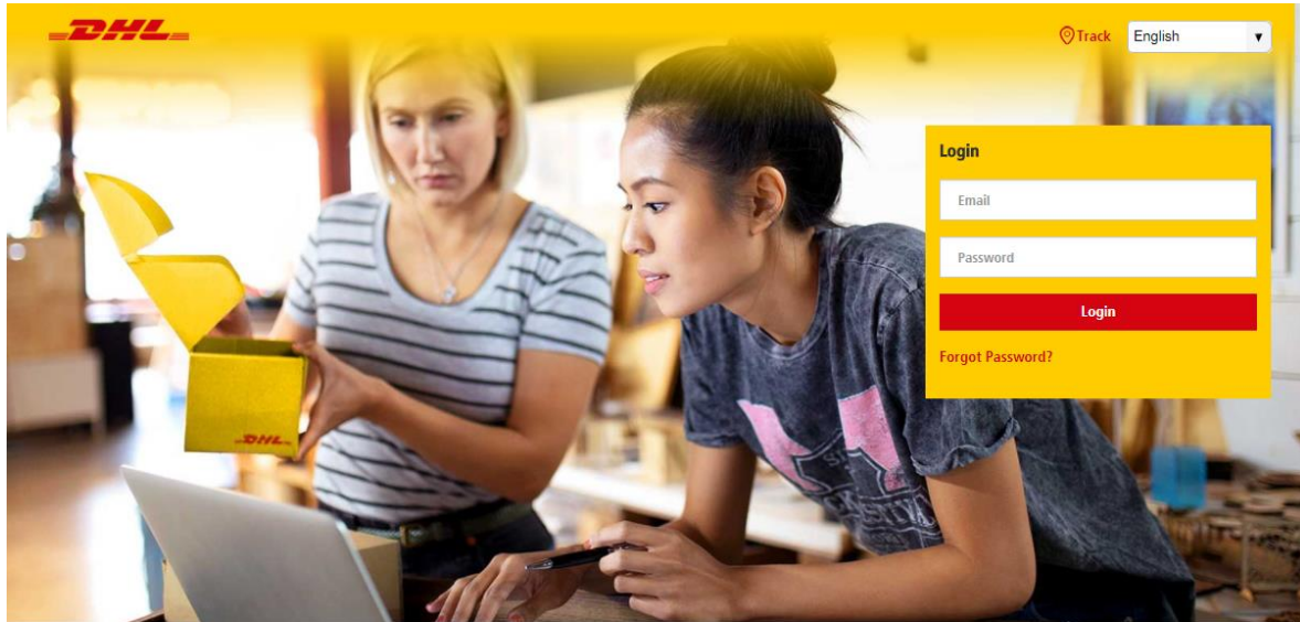
图 2. AP Portal